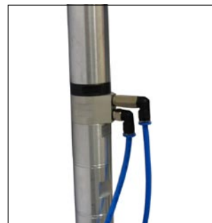
Pneumatische Rücklauf- sperre Art.-Nr. 78201-010087