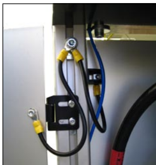
ESD-Version Art.-Nr. 78201-010091