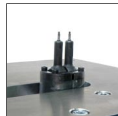
Bis auf 17 mm kann der Nietabstand mit der CP-Version reduziert werden. (CP = close pitch).