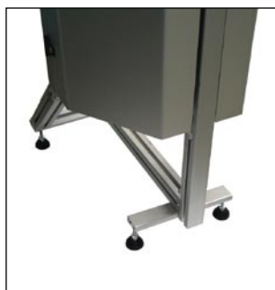
Standversion Art.-Nr. 78201-010089