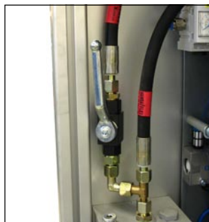
Modul-Einzelabschaltung Art.-Nr. 78201-010090