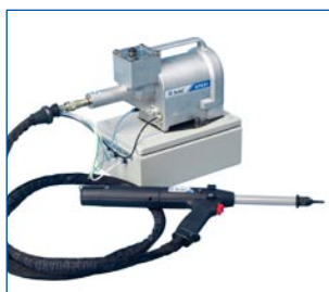
Typ 7536 Art.-Nr. 07536-02100* für \varnothing 1,6 mm Avlug®