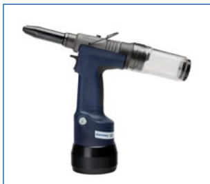
Genesis® nG1 Art.-Nr. 71203-00039 1) Art.-Nr. 71204-00039 2) für \varnothing 2,4 - 4,0 mm bis \varnothing 4,8 mm Al

Dornbruch-Blindniet-Geräte (*Grundgerät, jeweilige Nietausrüstung ist separat zu bestellen)