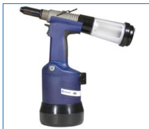
Genesis® nG4 Art.-Nr. 71233-02000 1) * Art.-Nr. 71234-02000 2) * f. Avdelok® u. Maxlok® ø4,8 - 6,4 mm u. Avtainer®