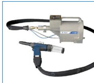
Genesis® nG2-S Art.-Nr. 71401-00039 1) Art.-Nr. 71404-00039 2) für \varnothing 3,0 - 4,8 mm