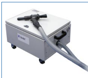
Typ 7287 Art.-Nr. 07287-00200* für Monobolt® \varnothing 10 mm