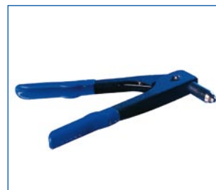
Handzange Art.-Nr. 07596-02000 für \varnothing 3,0 - 4,8 mm