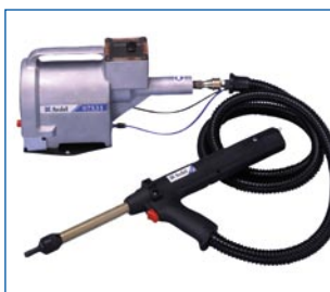
Typ 753 MkII Schlauchanschluss unten Art.-Nr. 07530-02100* für \varnothing 2,4 - 6,4 mm

Magazin-Blindniet-Geräte (*Grundgerät, jeweilige Nietausrüstung ist separat zu bestellen)