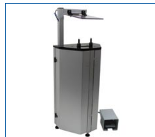
Mini-MBS Art.-Nr. 78200-010040* Basisversion für \varnothing 1,6 - 6,4 mm

Dornbruch-Blindniet-Geräte (*Grundgerät, jeweilige Nietausrüstung ist separat zu bestellen)