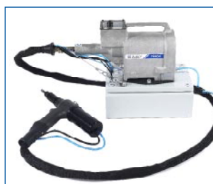
Typ 74405 Art.-Nr. 74405-01000* für M4 - M8 Versa-Nut®