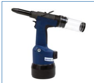
Genesis® nG2 Art.-Nr. 71213-00039 1) Art.-Nr. 71214-00039 2) für \varnothing 3,0 - 4,8 mm