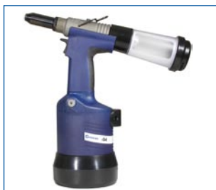
Genesis® nG4 Art.-Nr. 71233-02000 1) * Art.-Nr. 71234-02000 2) * für \varnothing 6,4 mm: Hemlok®, Avibulb® XT, Avinox® XT