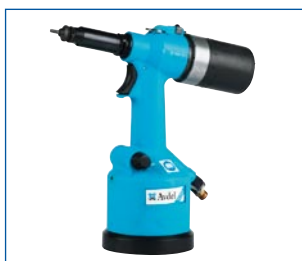
Typ 742 Drucklufthubgerät, weggesteuert Art.-Nr. 74200-12000* für M3 - M12

Blindnietmuttern-Geräte (*Grundgerät, jeweilige Nietausrüstung ist separat zu bestellen)