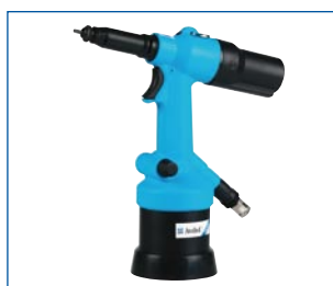
Typ 74201 Drucklufthubgerät, kraftgesteuert Art.-Nr. 74201-12000* für M3 - M8