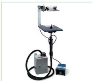
Typ 7539 in Grundplatte Art.-Nr. 07539-30010* für \varnothing 2,4 - 6,4 mm