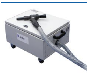
Typ 7287 Art.-Nr. 07287-00200* Avdelok®, Avtainer®, Maxlok® bis ø10,0 mm, Avbolt® bis ø8,0 mm

Blindnietmuttern-Geräte (*Grundgerät, jeweilige Nietausrüstung ist separat zu bestellen)