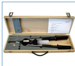
Handhebelzange Art.-Nr. 72005-00001 für \varnothing 4,0 - 6,4 mm und Monobolt® \varnothing 4,8 - 6,4 mm