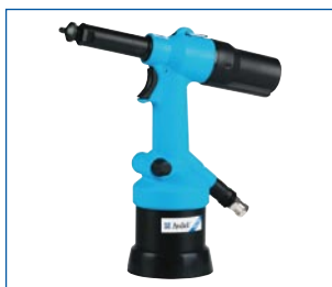
Typ 7429 Sechskant-Stanzgerät Art.-Nr. 74290-03000* für M4 - M10

Ausführliche Informationen zu Verarbeitungsbereich und Nietausrüstungen entnehmen Sie bitte den Betriebsanleitungen der jeweiligen Geräte auf unserer Website www.avdel-global.com oder kontaktieren Sie Ihren lokalen Avdel Repräsentanten.