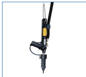
Typ 7539 hängend Art.-Nr. 07539-30050* für \varnothing 2,4 - 6,4 mm