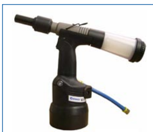
Genesis® G2 LB Art.-Nr. 71255-02000* für Avdelok® u. Maxlok® ø4,8 - 6,4 mm

Schließringbolzen-Nietgeräte (*Grundgerät, jeweilige Nietausrüstung ist separat zu bestellen, 1) 2) siehe Seite 1)