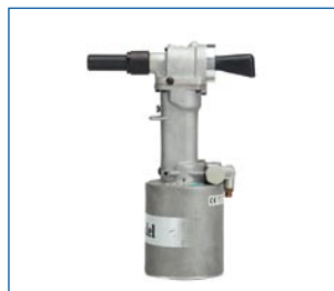
Typ 722 Art.-Nr. 07220-00200* f. Avdelok® ø4,8 - 9,6 mm Avbolt® bis ø8,0 mm