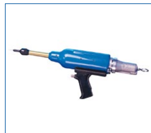
Typ 7271 Art.-Nr. 07271-02000* für \varnothing 2,4 - 6,4 mm