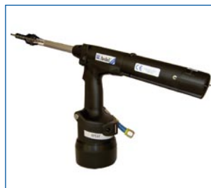
Typ 7537 Art.-Nr. 07537-02000* für \varnothing 2,4 - 6,4 mm