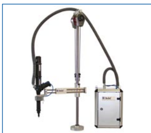
Typ 7539 im Geräteständer Art.-Nr. 07539-30000* für \varnothing 2,4 - 6,4 mm