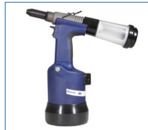
Genesis® nG3 Art.-Nr. 71223-00201 1) Art.-Nr. 71224-00201 2) für Monobolt® \varnothing 6,4 mm