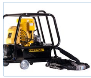
Typ 734 AV* für alle Infalok®, Avdelok® ø9,6 mm und Avbolt® ø8,0 - 16,0 mm