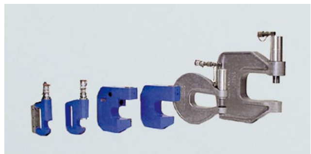
Varios batidores "C" están disponibles para cubrir las necesidades de las aplicaciones específicas.