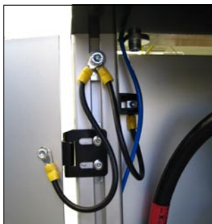
Version ESD Réf. 78201-010091