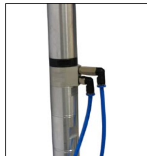
Curseur pneumatique Réf. 78201-010087