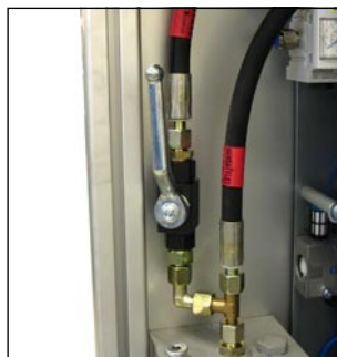
Vanne de sélection 1 ou 2 module(s) Réf. 78201-010090