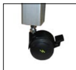
Roulette verrouillable Réf. 78201-010088