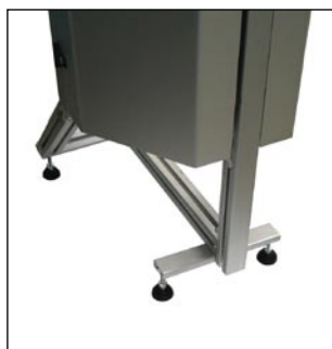
Version poste fixe Réf. 78201-010089