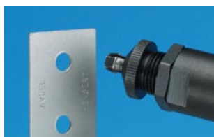
Pezzo con foro tondo