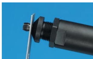
Inserire il punzone (fissato sull'attrezzo 74290) nel foro tondo