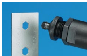
Pezzo con foro esagonale punzonato dalla 74290, pronto per ricevere un inserto filettato Hexsert®